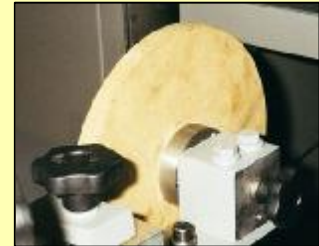
Pare-éclats avec disque, 6 positions manuelles