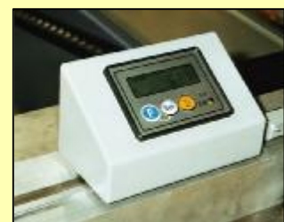
Lecteur digital pour la butée de longueur