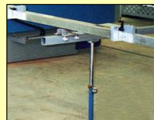
Support supplémentaire de butée de longueur pour des pièces plus longues