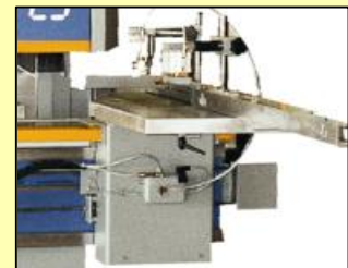
Table automatique avec plusieurs vitesses