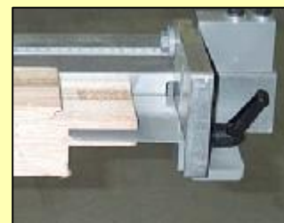
Grandes butées escamotables